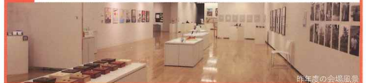
昨年度の会場風景