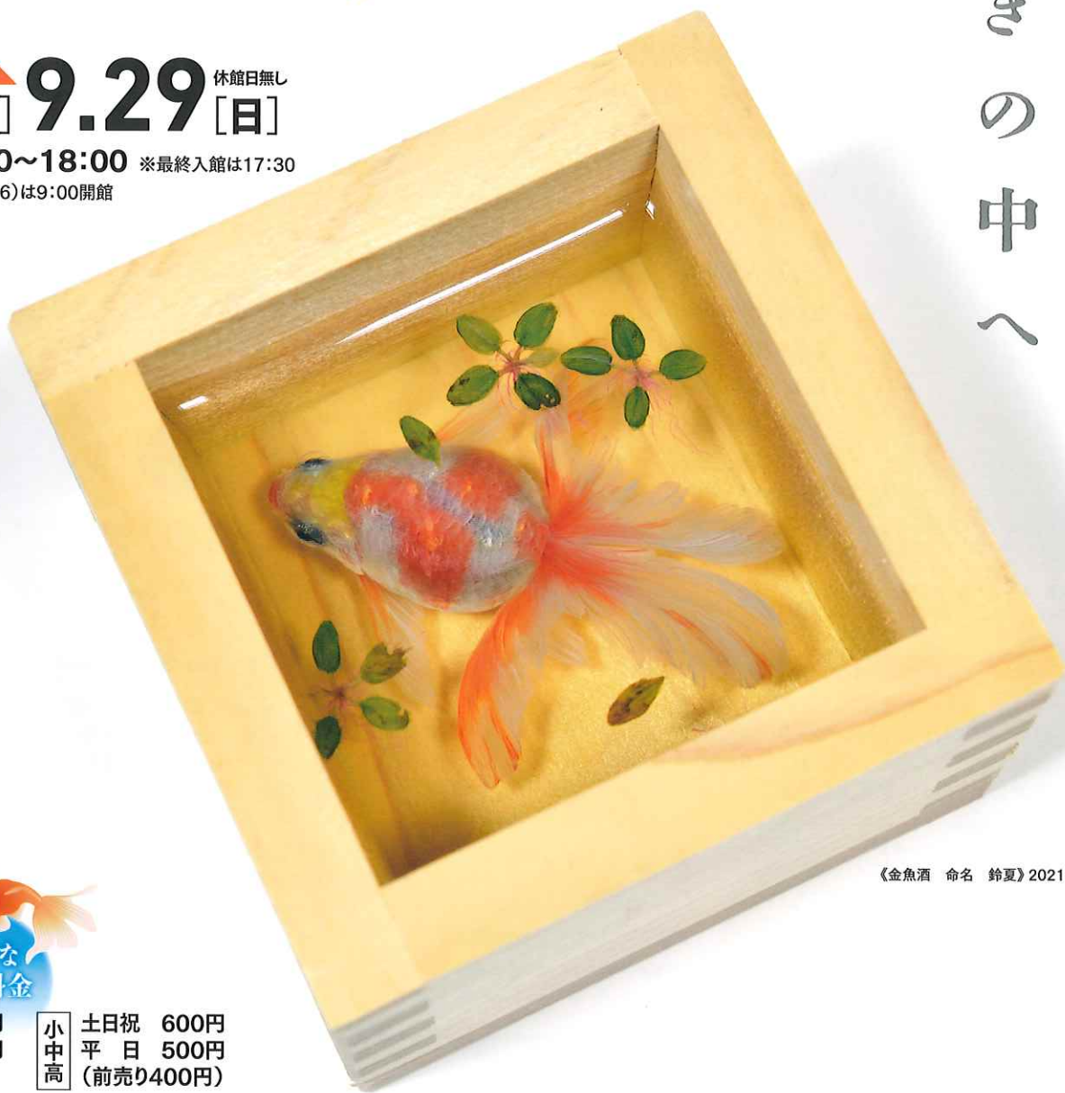
《金魚酒 命名 鈴夏》2021年