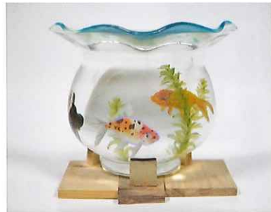
《ハーフ・ユニバース》2018年