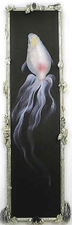
《白澄 命名 空密》2011年